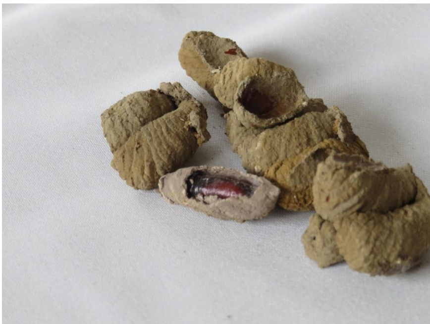
Urnas avec larves